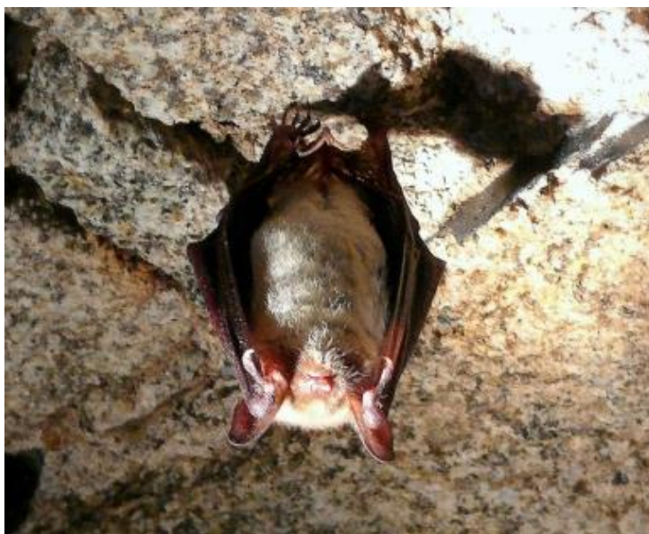
Grand murin – Myotis myotis