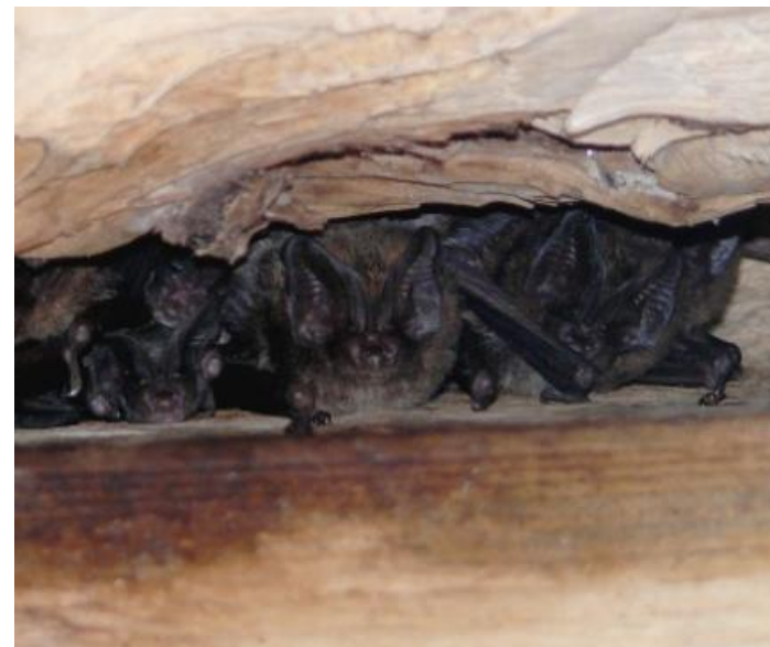
Barbastelle d'Europe – Barbastella barbastellus