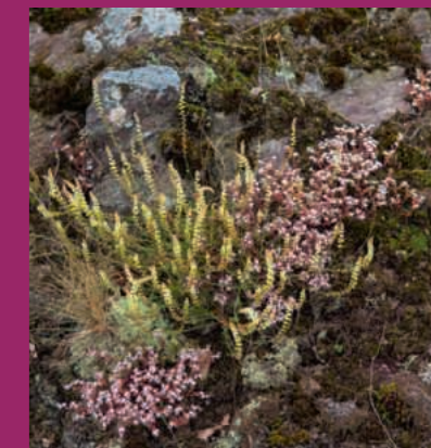
Orpin des anglais et Astérocarpe faux sésame

De nombreuses espèces d'oiseaux nichent dans les parages : la fauvette pitchou, le busard Saint-Martin, le martin-pêcheur, le pic noir... Avec un peu de chance, vous observerez le faucon crécerelle et l'épervier d'Europe. Certains soirs d'été, on entend même chanter l'engoulevent d'Europe qui rappelle le doux ronron... du solex!