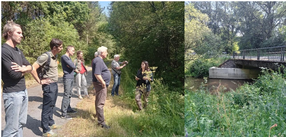
Découverte sur le terrain des aménagements pour le passage des loutres au niveau du pont de l'Edre

Après la présentation en salle des aménagements pour la loutre sur quatre ouvrages sur la vallée du Canut, les membres du copil ont pu découvrir sur le terrain les aménagements du pont de l'Edre.